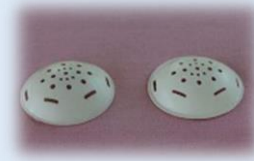
۱- آستیگماتیسم: انحنای قرنیه یا عدسی

-منبع: بیماری های چشمی برونر و سوارث ۲۰۱۸ تهیه کننده: توران سوارنیک کارشناس پرستاری تأیید کننده: دکتر سیده فریبا فتاحی جراح و متخصص چشم واحد آموزش ارتقاء سلامت تابستان ۱۴۰۰